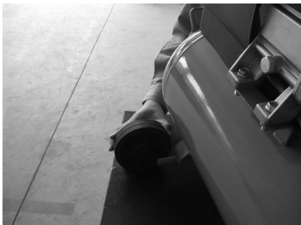
Atașați roțile de transport