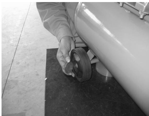
Folosind capacul de plastic acoperiți piulița